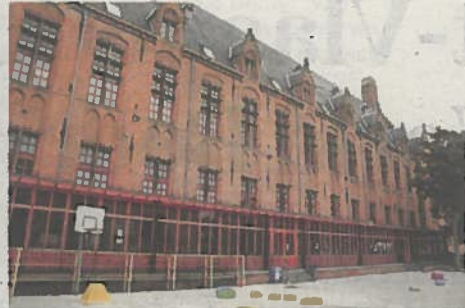
De kleuterafdeling van De Springplank heeft haar onderkomen in de lokalen van Howest.