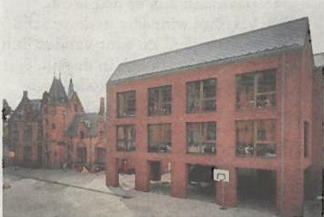
De nieuwe school staat in schril contrast met de neogotische site.