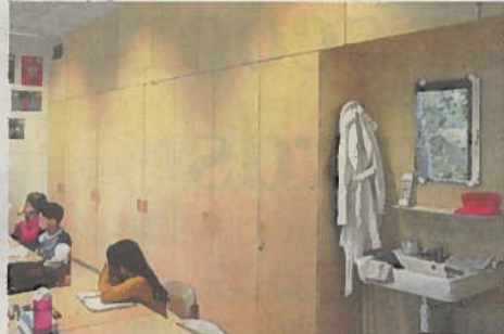
In de klassen werd met lichte kleuren gewerkt. Telkens één wand bestaat uit kasten.