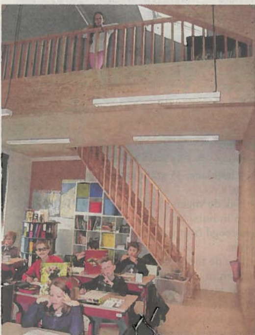
De bovenste klaslokalen van het nieuwe schoolgebouw kregen ook een mezzanine.