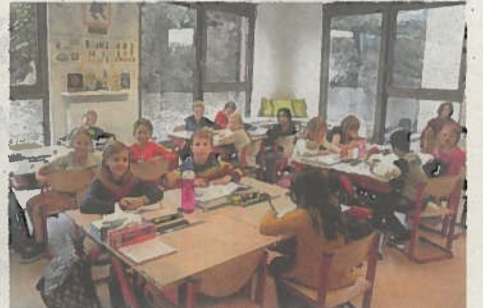
De vele ramen zorgen ervoor dat het licht nauwelijks moet branden tijdens de lessen.